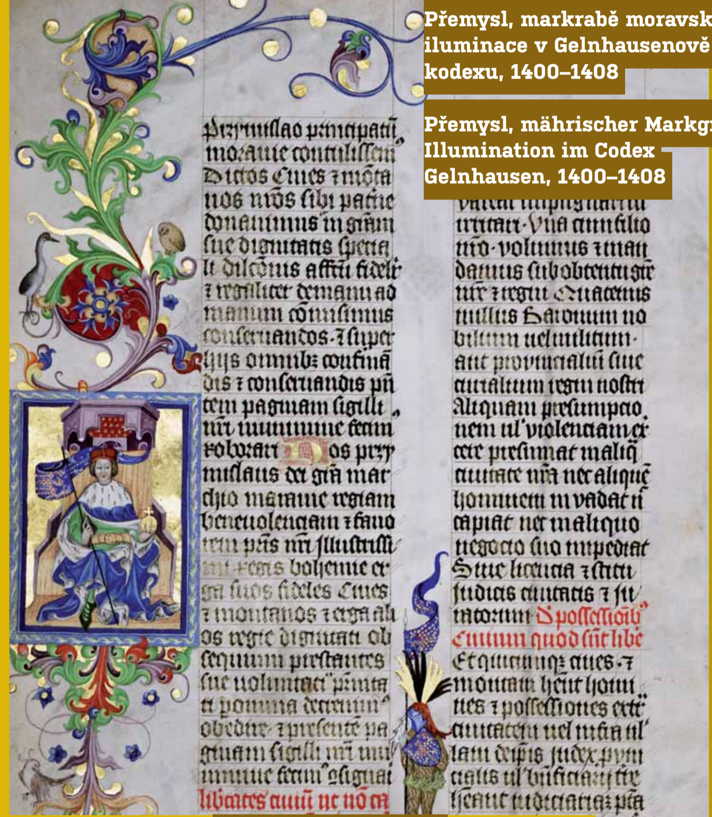
Přemysl, markrabě moravský, iluminace v Gelnhauseusově kodexu, 1400-1408