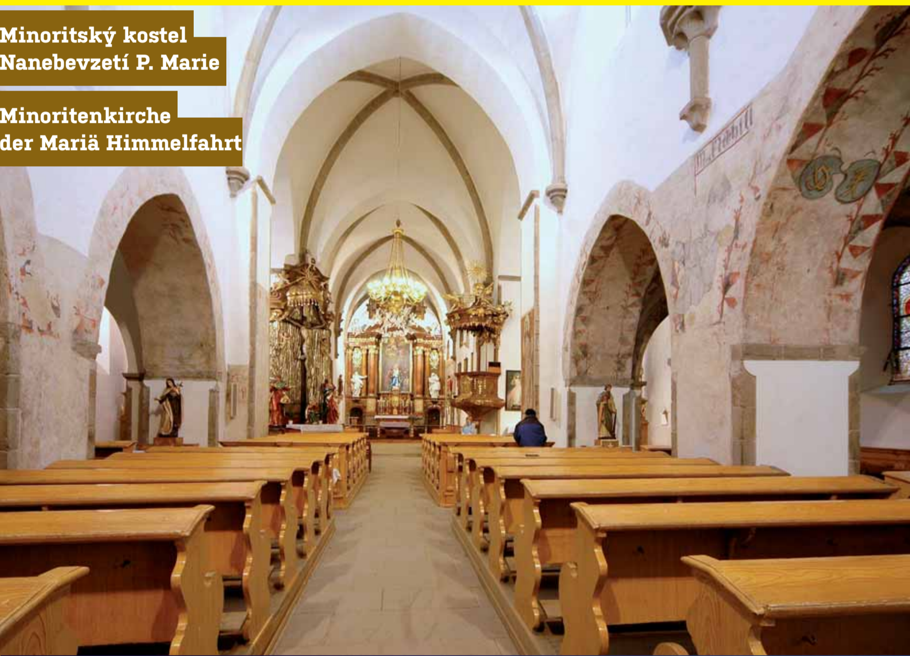
Minoritský kostel Nanebevzetí P. Marie