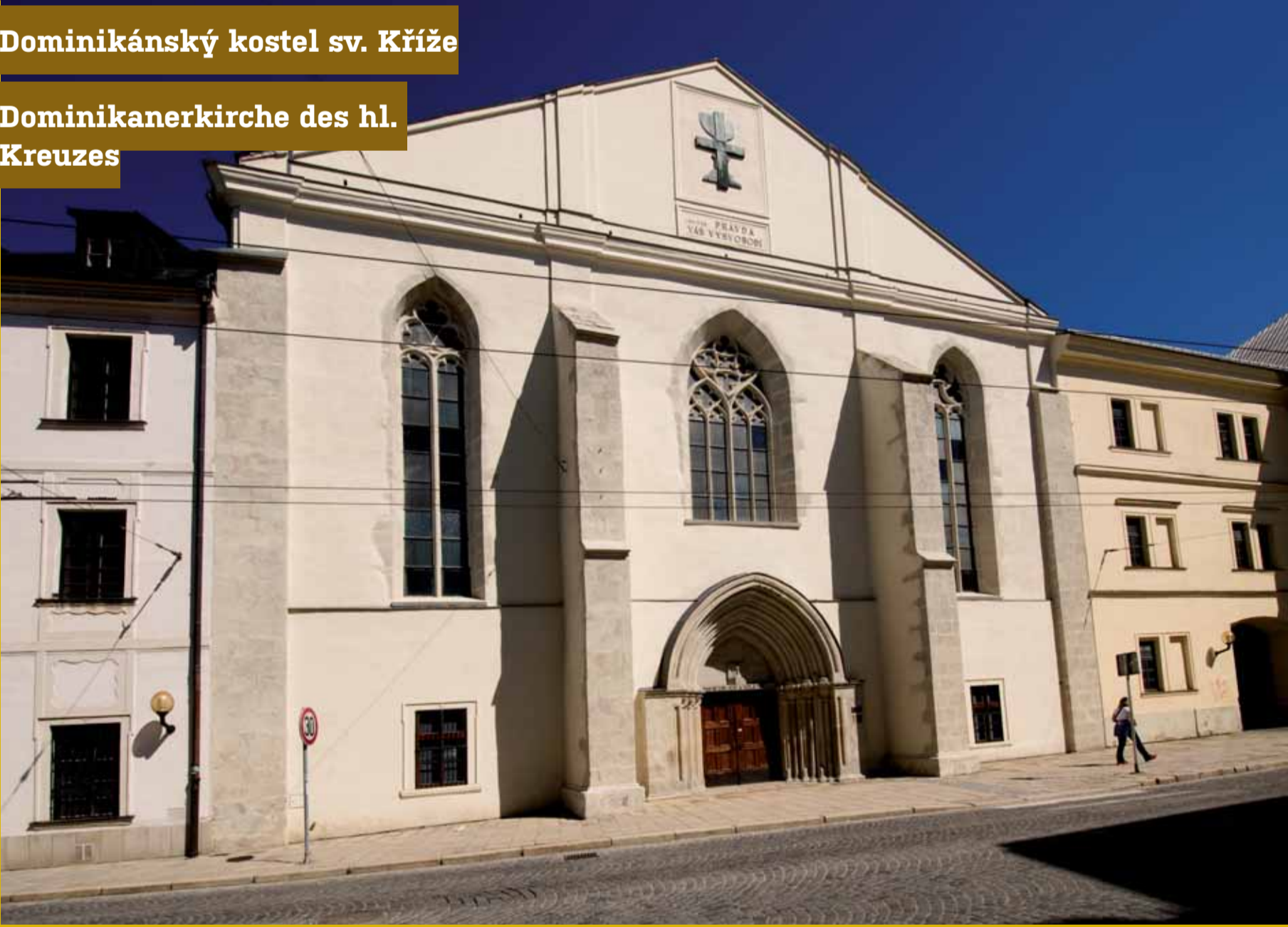
Dominikánský kostel sv. Kříže