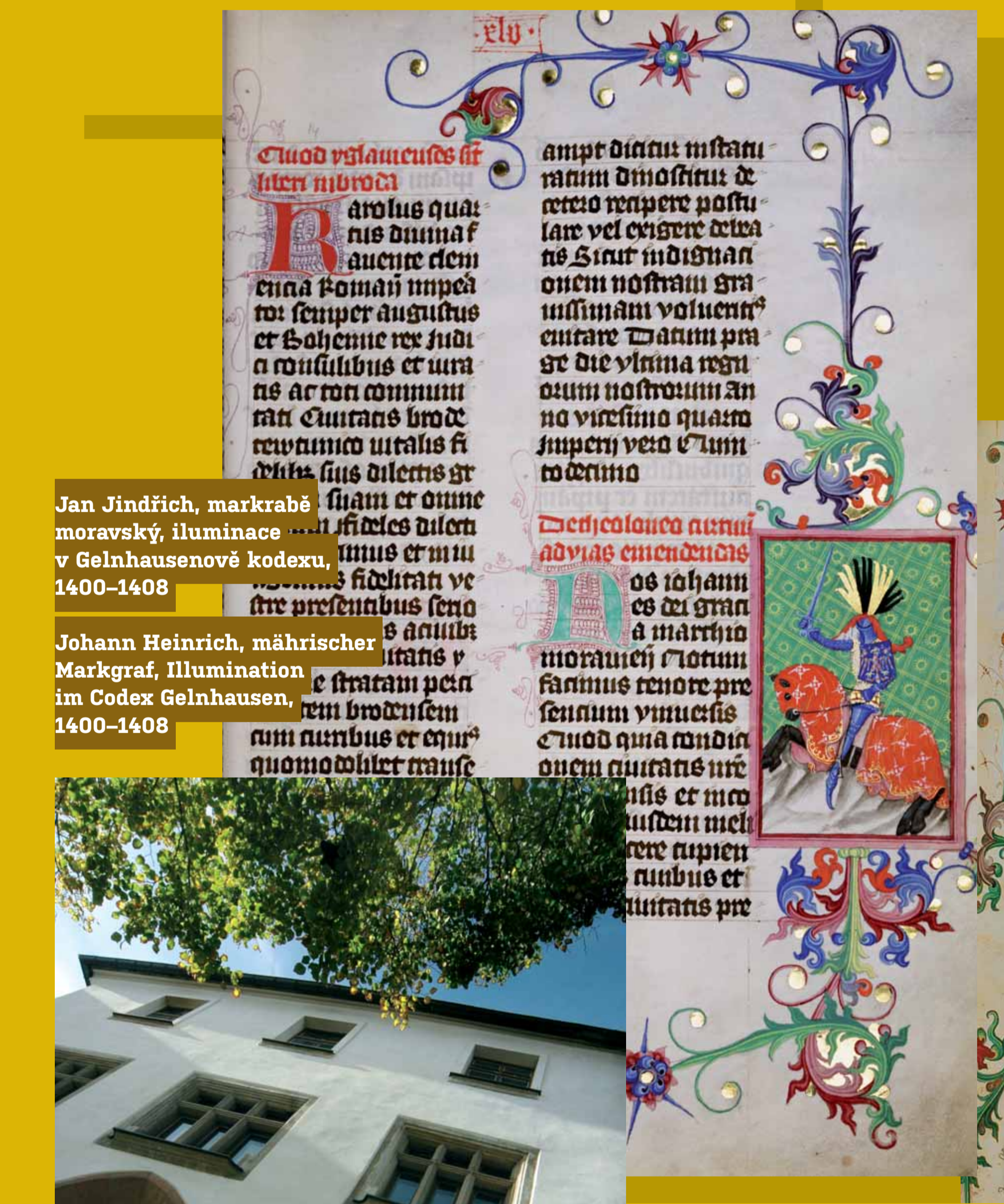
Jan Jindřich, markrabě moravský, iluminace v Gelnhauseusově kodexu, 1400-1408