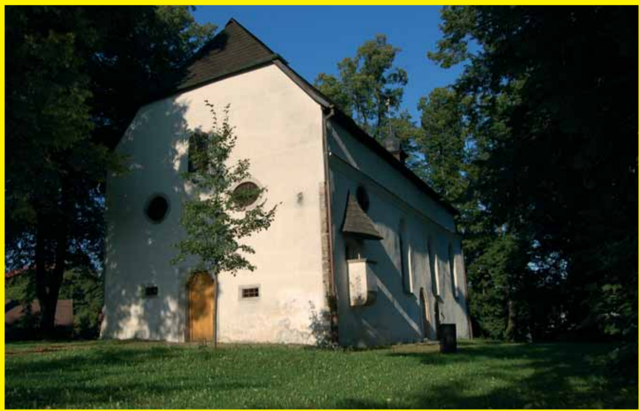
Kostelík sv. Jana Křtitele