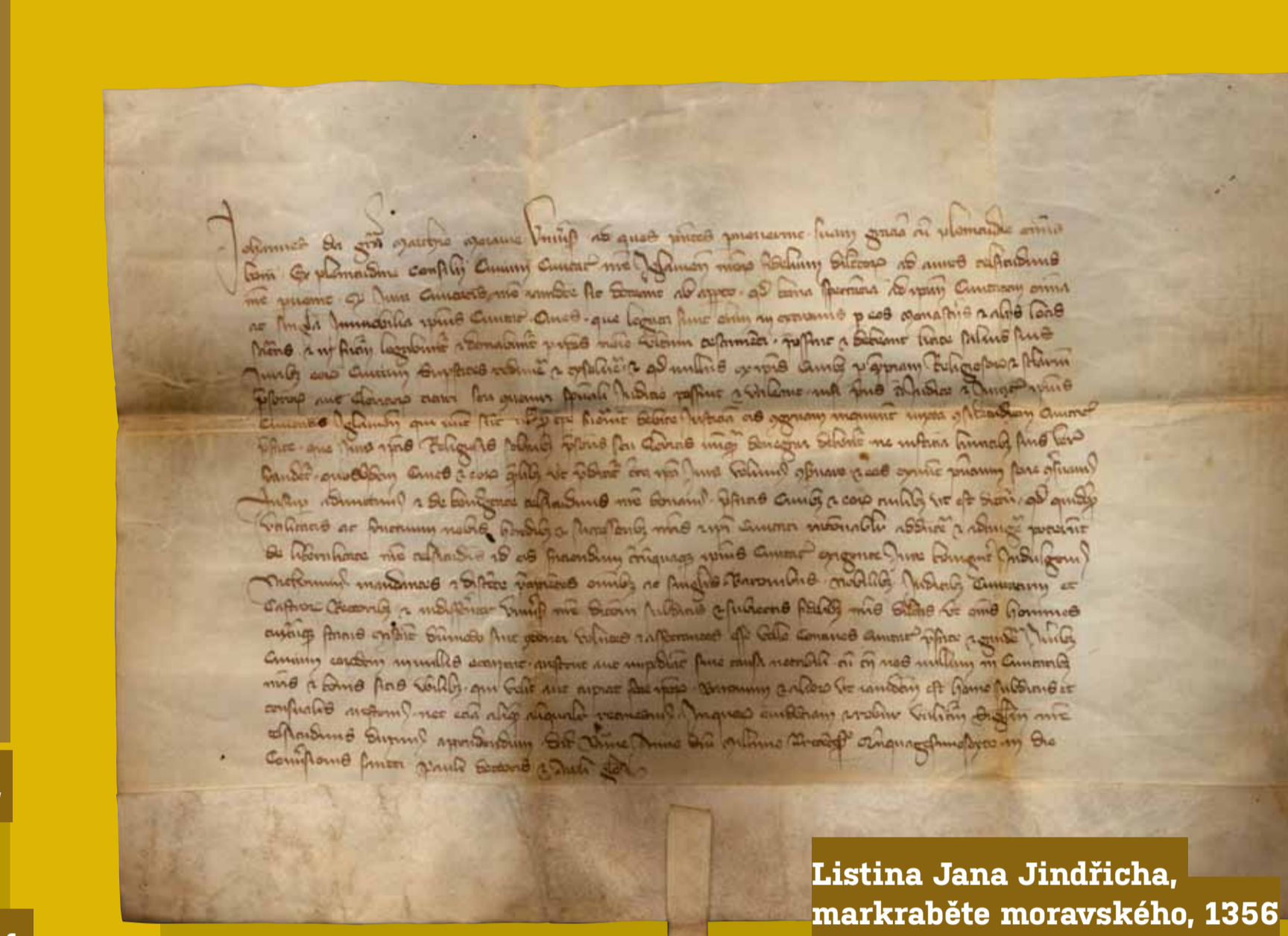
Listina Jana Jindřicha, markrabě moravského, 1356